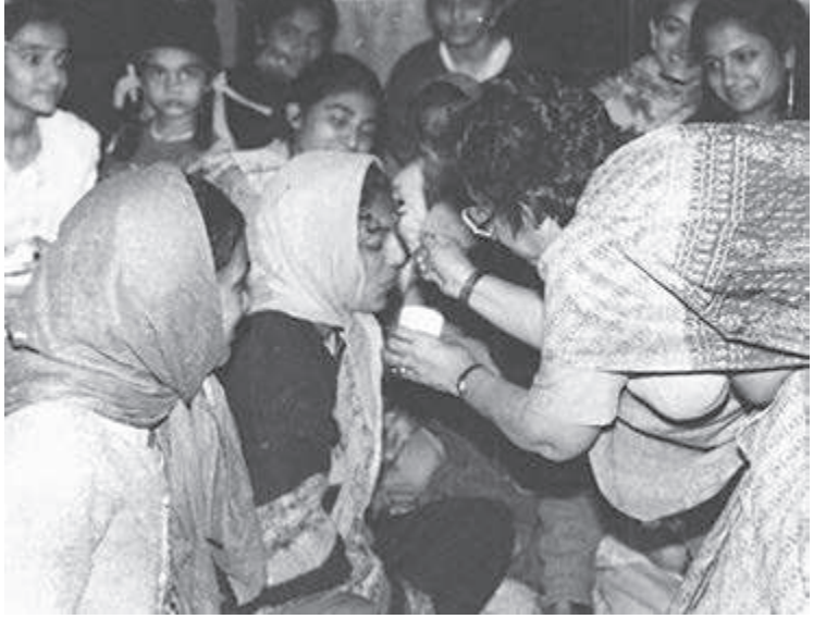
ઉપવાસ અને પારણાં: વિચારોને આચારમાં ઉતારવાની 'જોખમી' શરૂઆત

બંધ કરાવવા, વિદ્યાર્થી-ચૂંટણીઓમાં બેફામ ખર્ચા કરવા બહુ સામાન્ય બાબત હતી. જ્યાં શિક્ષકોને પણ આ તત્ત્વોનો ખોફ હોય અને તે પણ ગણતરીના હિંમતવાન વિદ્યાર્થીઓનો સાથ આપવામાં અચકાતા હોય ત્યાં વિદ્યાર્થીઓ કોની સામે જુએ? ઓએસિસે આમ થતું અટકાવવાનું બીડું ઝડપી લીધું. પરીક્ષા મુલતવી રખાતી અટકાવવા—વર્ગો ચાલુ રખાવવા જરૂર પડ્યે ઓએસિસના યુવાનોએ હાથમાં હાથ પરોવી કિલ્લેબંધી પણ કરી અને એમ કરતાં પથ્થરમારો પણ સહ્યો—બે-ચાર જણ ઘાયલ પણ થયા—પણ પરીક્ષાઓ તો થઈ